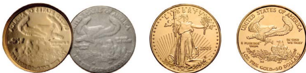
AMERICAN EAGLE, 1 UNZE GOLD, MIT KERN AUS WOLFRAM. | AMERICAN EAGLE, 1 ONCE D'OR, AVEC NOYAU EN TUNGSTÈNE.