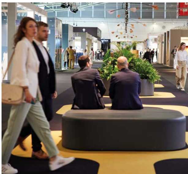
INHORGENTA MÜNCHEN 2022 | INHORGENTA MUNICH 2022

Die Inhorgenta München musste vom traditionellen Februartermin um zwei Monate in den April verschoben werden. Mit 732 Ausstellern aus 33 Ländern verzeichnete die internationale Fachmesse trotz bestehender Pandemie in vielen Ländern eine positive Bilanz. Auch das Interesse bei den Besuchern war gross. Rund 17.285 Personen konnte die Messe begrüßen. Die Gyr Edelmetalle war mit ihren Alliance-Ringen in der Halle A2 vertreten und zieht insgesamt auch ein positives Fazit. Die vier Messe-Tage boten Gelegenheit für neue Kontakte, interessante Gespräche und einen wertvollen Austausch mit der Branche. Save the date: Die nächste Inhorgenta findet vom 24. bis 27. Februar 2023 in München statt.