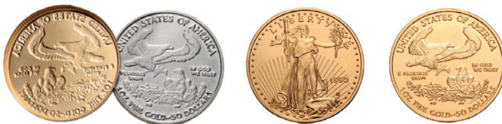
AMERICAN EAGLE, 1 UNZE GOLD, MIT KERN AUS TANTAL. | AMERICAN EAGLE, 1 ONCE D'OR, AVEC NOYAU EN TANTALE.

En mai 2022, deux onces d'or achetées depuis peu par un négociant professionnel, ont été proposées à la société Erwin Dietrich AG à Zürich. Le recto et le verso ne présentaient aucune différence par rapport aux pièces originales. La reproduction de la bordure était parfaite. Mais après un contrôle effectué à l'aide d'appareils de contrôle spéciaux, il s'est avéré que les deux onces étaient fausses. Le vendeur, très inquiet, s'est rendu au contrôle des métaux précieux à l'aéroport de Zürich sur les conseils de la société Erwin Dietrich AG. Une première vérification rapide n'a pas permis aux douaniers de constater des différences avec les véritables onces d'or. Toutefois, sur la base du résultat de l'examen effectué par la société Erwin Dietrich AG, il a été supposé que les pièces présentaient un noyau non précieux. Pour en avoir le cœur net, un collaborateur du contrôle des métaux précieux s'est livré à un travail méticuleux sur les pièces, à l'aide d'outils d'horloger. Il a réussi à détacher l'enveloppe des pièces et le noyau non précieux supposé est apparu.