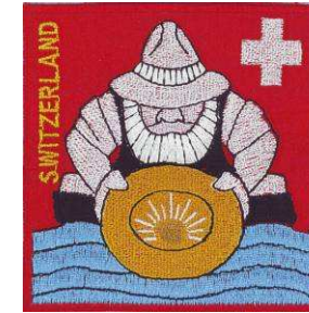
Association Suisse des Chercheurs d'Or (SGV)

Le présent code d'honneur a été approuvé et mis en vigueur lors de l'Assemblée Générale du 26 avril 2008. Il est publié sur site internet ( http://www.goldwaschen.ch ) et remis à chaque membre lors de son admission à la SGV.